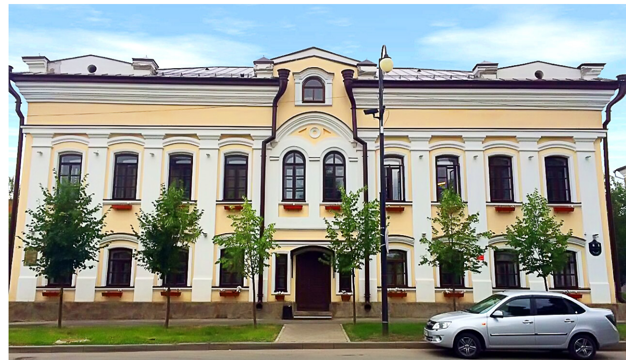
«Дом Апанeeвых» по ул. Сафьян, дом №5