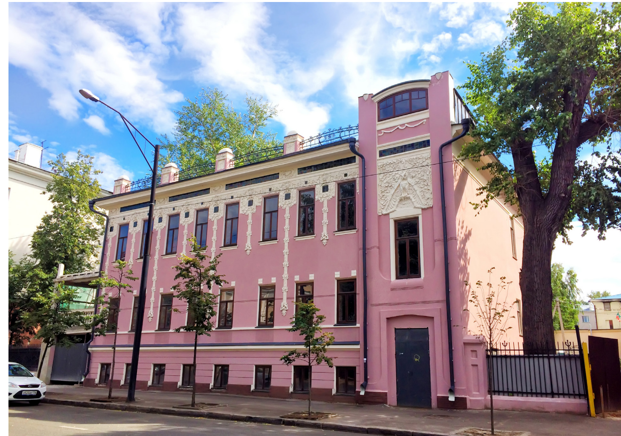
«Дом Токарева», ул. Большая Красная, дом №52