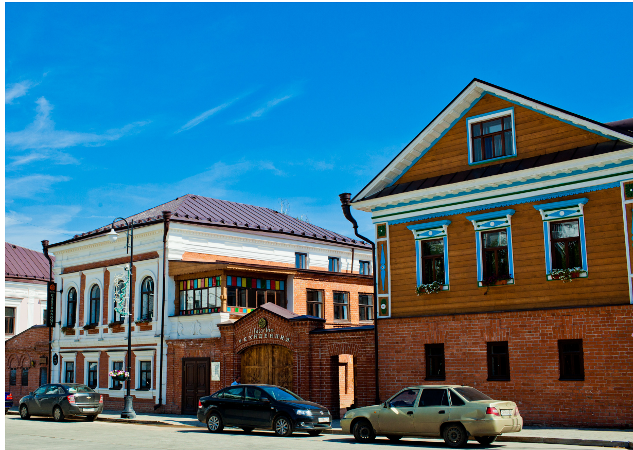
Комплекс зданий: «Дом Казакова», «Усадьба Кушаева»